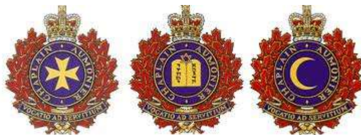
Emblemas de capellanes castrenses canadienses