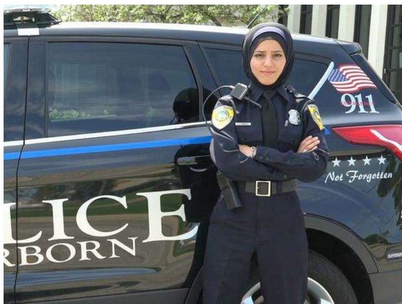
Policía de Dearborn (Michigan, EE.UU.A.)

La policía federal es la tercera en adoptar esta medida, que ya está vigente para los agentes de las ciudades de Toronto, desde 2011 y Edmonton, desde 2013. Desde principios de los 90 los policías tienen derecho a usar turbantes. 2