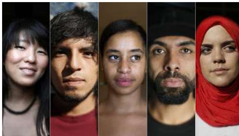
Yo también soy español

Ser español ya no es lo que era. La respuesta estereotipada —blanco, católico y bajito— es cada vez menos realista. Era válida no hace tanto: España, país emigrante en casi toda su Historia reciente, albergó siempre una sociedad homogénea, poco habituada a lo diferente. Cuando lo diferente llegó, se les identificó sin rodeos: inmigrantes. Llegaron de forma masiva y en un período de tiempo mucho menor que en otros países europeos. Se asentaron, se incorporaron al mundo laboral y tuvieron hijos. Hijos españoles.