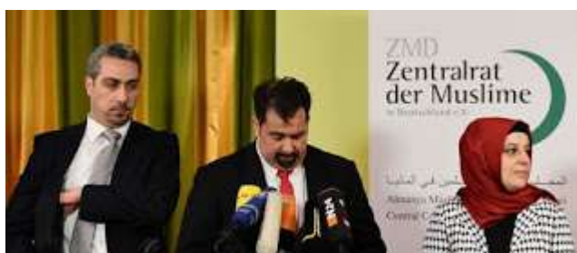
Representantes del Consejo Musulmán de Alemania

Petry insistió ante los medios en que su partido no es islamófobo, sino que respeta los derechos "de los musulmanes dispuestos a integrarse y a aceptar las leyes alemanas", para a continuación defender los postulados de AfD, partidaria de prohibir símbolos islámicos, incluidos los minaretes o el velo islámico.