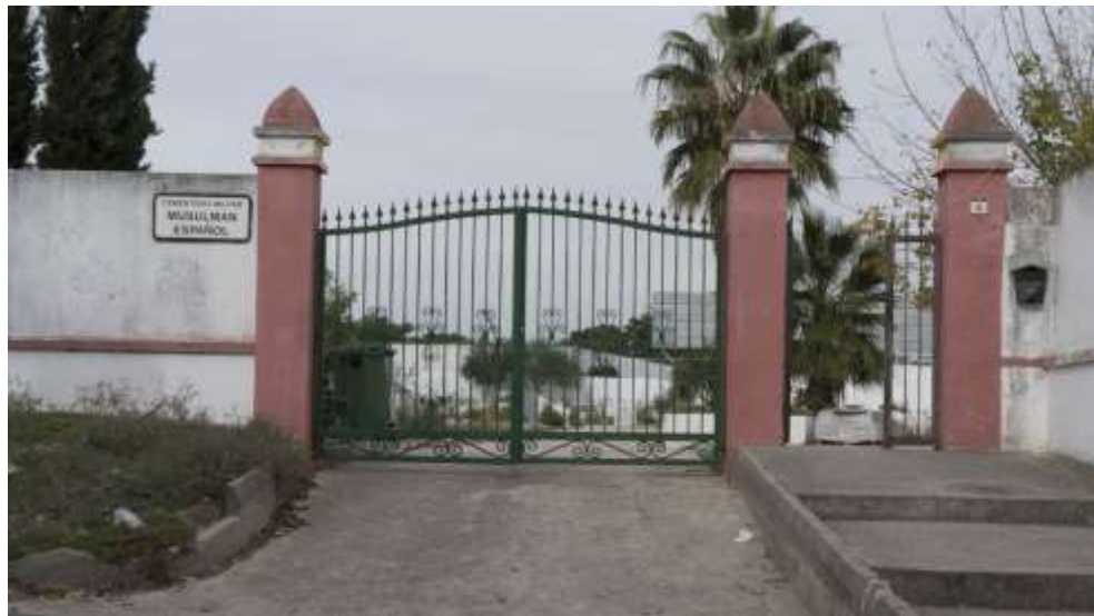
Macbara de Griñón (Madrid)