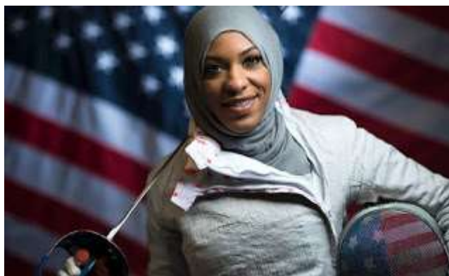
Ibtihaj Muhammad, primera deportista de EE.UU. en competir con pañuelo musulmán

Hace 17 años, la careta de esgrima fue, como las mangas largas de la chaquetilla y el pantalón hasta los tobillos, el refugio para Ibtihaj Muhammad, una niña negra y musulmana de Nueva Jersey (Estados Unidos) que no encontraba en el béisbol, el tenis, el voleibol o el atletismo forma de hacer comulgar su entrega al deporte con los requerimientos de vestimenta que sigue por su fe. En 2016, quitarse esa careta es orgullo y reivindicación, y también, historia.